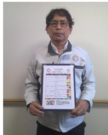
宣言書を手にする守岡社長