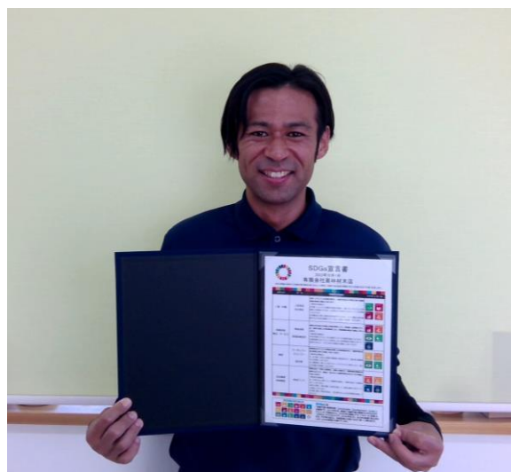
宣言書を手にする高林専務