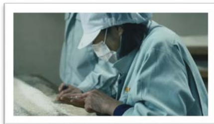
<PR動画撮影風景・動画イメージ>