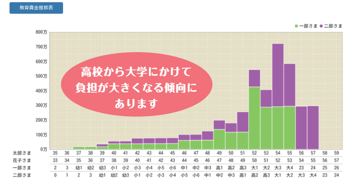
教育資金のグラフ