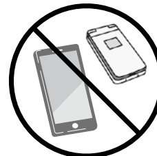
スマートフォン・携帯電話

★通帳・キャッシュカードがご利用できない場合は、お近くの窓口までお問い合わせください。