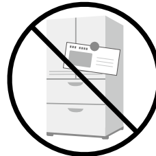
マグネットではさまない