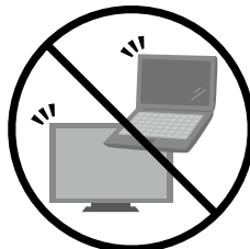
テレビ・パソコン