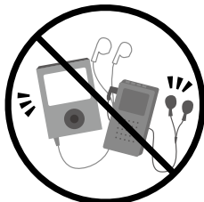
AV機器 (イヤホン、携帯音楽プレーヤー・ 携帯ラジオ等)