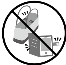
マグネットの留め具 (バックやスマホケースなど)